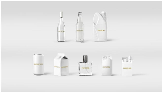
隐形数字识别技术® 解决方案

隐形数字识别技术® ——这是一种隐形数字标记，采用普通可见的油墨或光油以及标准的印刷工艺（胶印、凹版印刷、柔印、激光、喷墨等）进行印刷，可应用于各类印刷产品，如折叠盒、标签、传单、官方文件和吸塑包装。