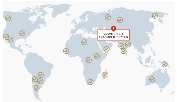
实时假货警报将直接发送给你

（日期、时间、地点、用户、图像数据和认证结果）。它使品牌所有者能够实时监控假冒伪劣产品的情况。